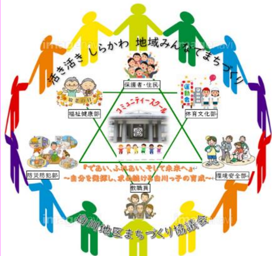
※ 『CS』とは「コミュニティスクール」のこと

地域活動を支える学校運営協議会およびまちづくり協議会は、少子高齢化が進む中、3自治会等住民全員と共に環境を整え、安心安全な地域を創り上げる役割を担っています。